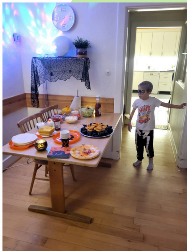
Halloweenfirande i Makalösa Helsingborg