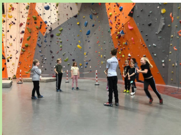
Klätterhallen med Umeås Makalösa