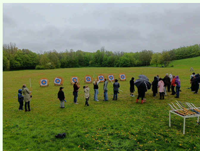
Prova på bågskytte i Lunds Makalösa