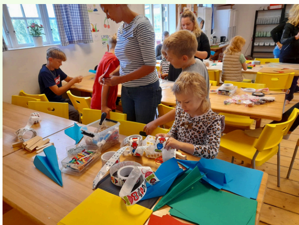
Draktillverkning och drakflygning en blåsig dag i Makalösa Örebro