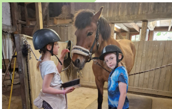
Rida häst och klappa djur med Makalösa i Malmö