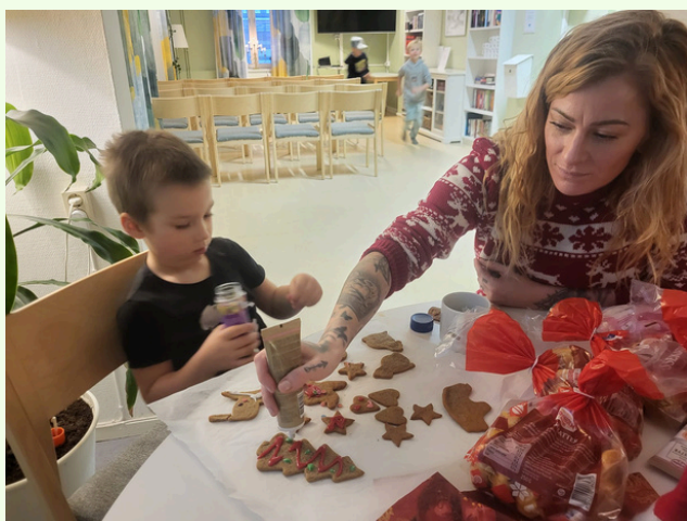
Pepparkaksbakning i Makalösa Mjölby

Det kan vara minigolf, skogsutflykter, sommarfester eller att kolla på Melodifestivalen tillsammans. Här kommer några exempel från våra föreningar!