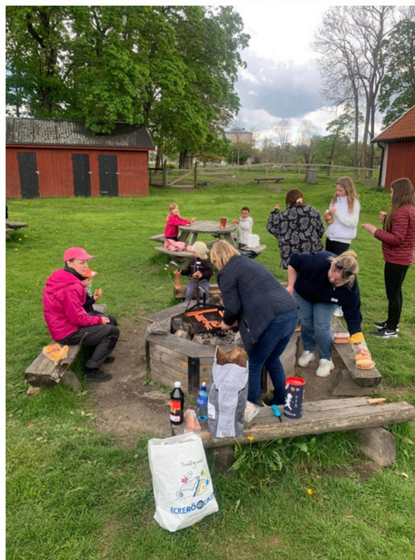
Morsdagsfirande på 4H-Gård med Makalösa Uppsala